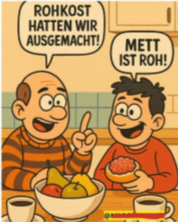
Meine Kindheit Teil 2 Nach einer Idee von Alf Bo.